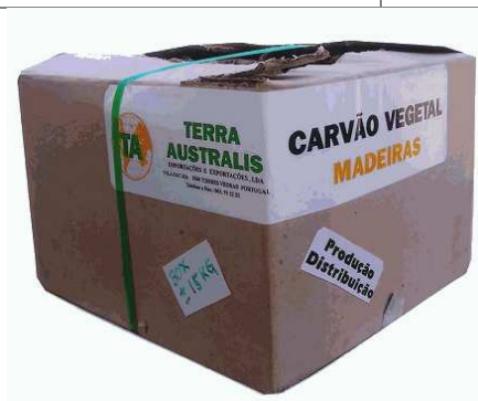
CAISSE CARTON > 10 Kg