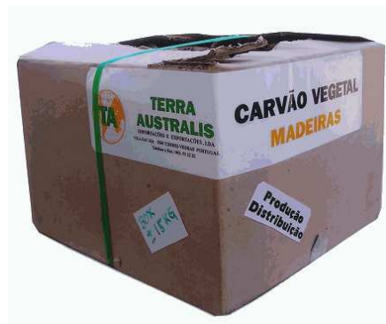
CAISSE CARTON > 15 Kg