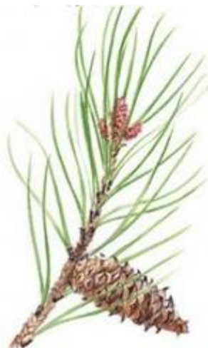
Pin des Landes

Le solde avant enlèvement des marchandises.