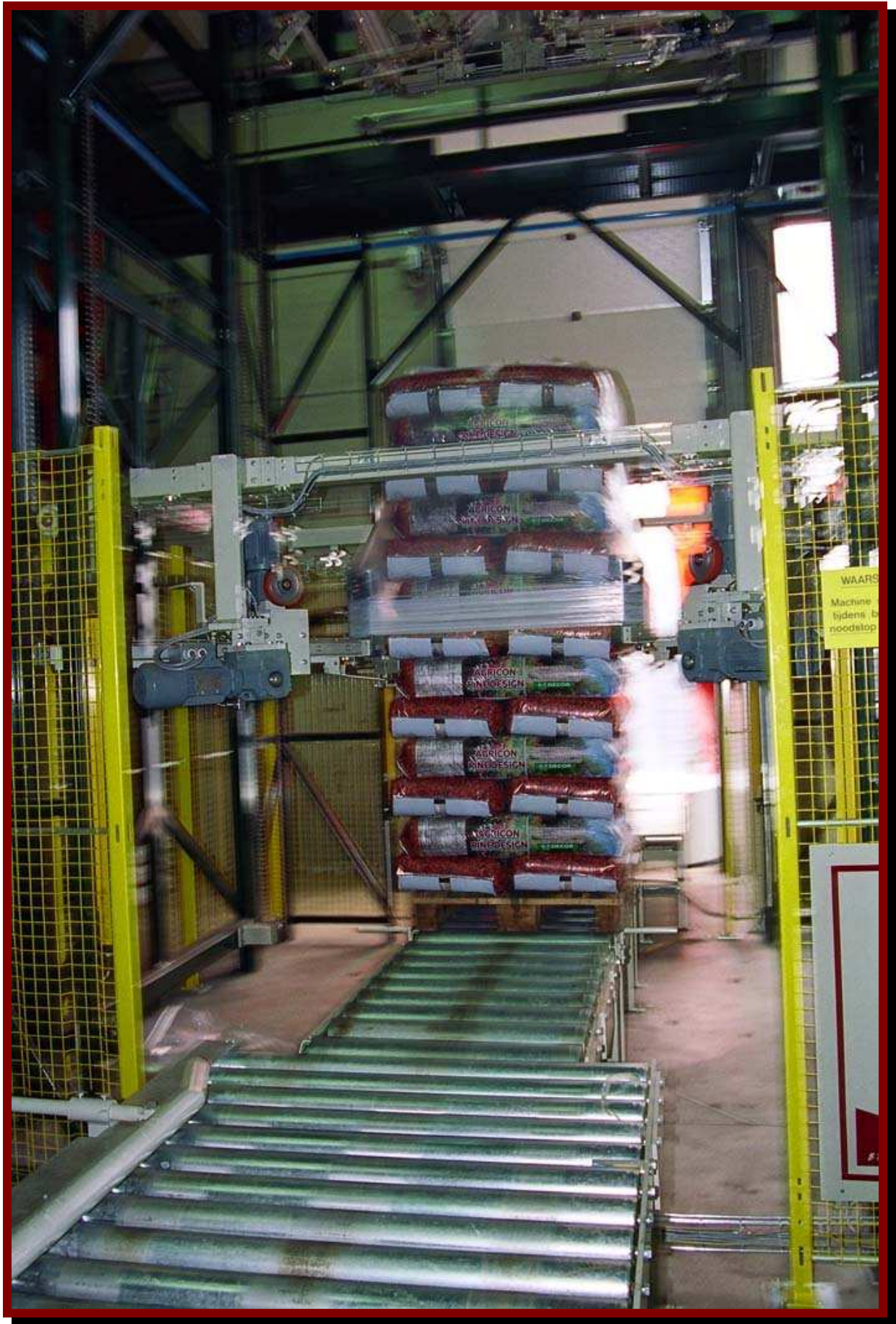
A la fin de la chaîne, une housse étirable entoure chaque palette.