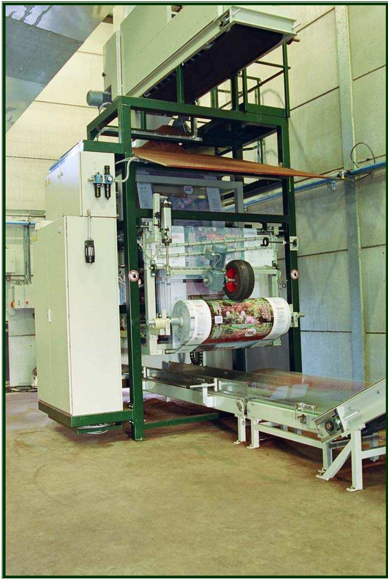
L'emballage imprimé est mis sur la machine en rouleau